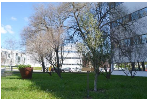
O proxecto de catalogación permite identificar ás especies arbóreas máis significativas do campus