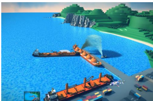
Difunde os labores de adestramento que se levan a cabo para loitar contra a contaminación mariña accidental