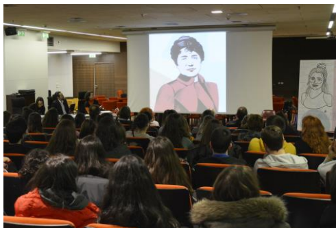
O campus de Ourense sumouse este martes á conmemoración do día da escritora galega