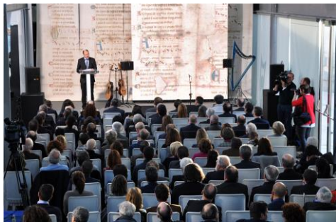
O Pergamiño Vindel regresa a casa deixando atrás o fogar