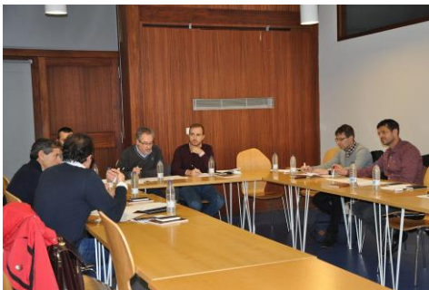
Un intre da reunión na sala II do edificio Miralles