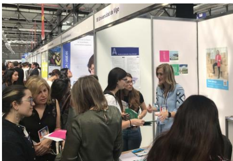
A vicerreitora de Estudantes no stand da Universidade de Vigo na Fiesa atendendo ao alumnado