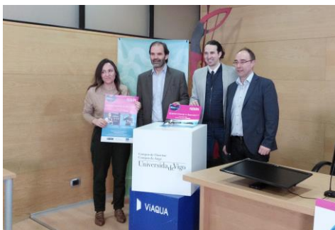
A xornada celebrárase no campus o xoves 15 de marzo.

O campus de Vigo acollerá o vindeiro 17 de abril a primeira xornada organizada en Galicia do Programa Prevent 2018, unha iniciativa posta en marcha polo Injuve, Instituto de la Juventud, en colaboración coas universidades integrantes da Rede de Universidades Saudables –entidade creada en 2008 e da que Vigo forma parte da súa xunta directiva- e as respectivas direccións xerais de Xuventude das comunidades autónomas. O obxectivo é promover hábitos de vida saudables e a saúde cardiovascular da mocidade e facelo a través de diferentes talleres nos que participen técnicos de xuventude, profesionais da saúde e a actividade física e, sobre todo, os propios mozos e mozas e resto de persoas interesadas. +info