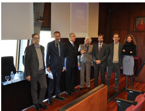
Foto de familia das e dos participantes na xornada