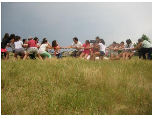
O campus acollerá o 12 de abril un encontro pedagóxico centrado nesta cuestión.