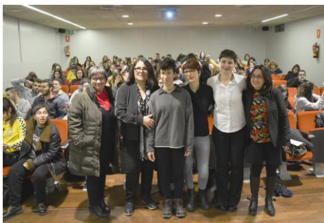
O campus acolleu este martes unha xornada sobre esta cuestión