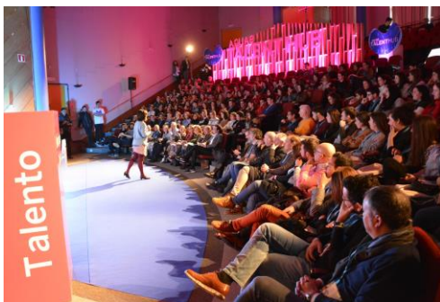
O campus acolleu este xoves o arranque da edición deste ano do Aquae Talent Hub