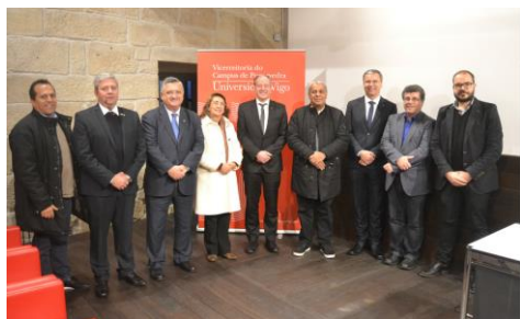
A Universidade reforza os seus lazos co Brasil ao abeiro de 'Lapassion'

234 alumnos e alumnas de primaria e secundaria, procedentes de diferentes centros de ensino de Galicia, participan desde a mañá deste xoves en Pontevedra no VII Encontro Galego de Escolas Asociadas á Unesco, unha rede que integra a centros de ensino de diferentes niveis e da que tamén forma parte a Facultade de Ciencias da Educación e do Deporte. +info