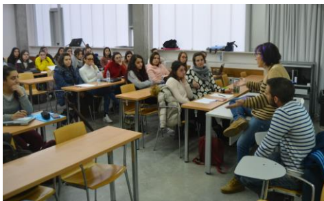
O día a día da mocidade transexual, en primeira persoa