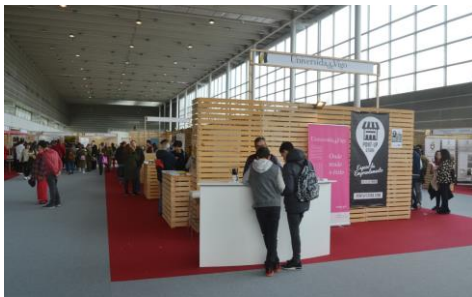
A Universidade de Vigo conta cun stand propio neste salón da educación