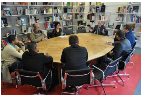
Un intre da reunión do reitor coa delegación brasileira