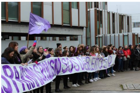
Imaxe da concentración celebrada no campus de Vigo