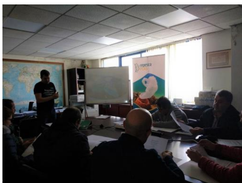
Un intre da xornada formativa que tivo lugar no Porto de Marín