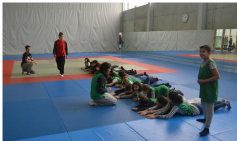
Participantes no obradoiro de radio.