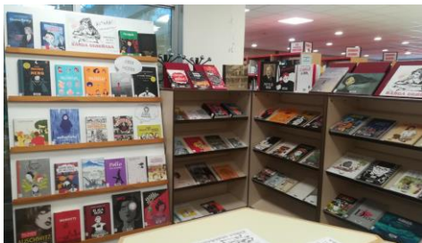
A mostra inclúe diferentes tipos de novelas ilustradas con temática feminista