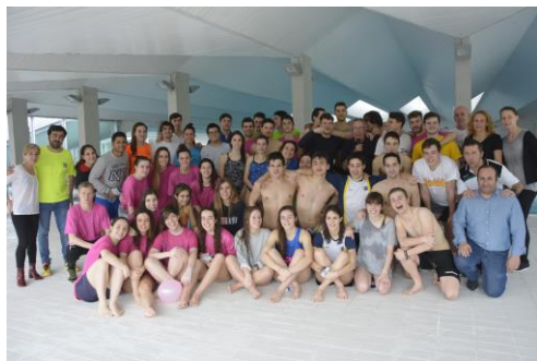
A cita celebrouse este xoves na piscina do campus

Dende fai varios anos a Universidade vén desenvolvendo diferentes programas de voluntariado cos que anima á comunidade universitaria a amosar a súa cara máis solidaria. Ás iniciativas máis exitosas, como as organizadas pola Oficina de Medio Ambiente, súmanselle este ano dous novos programas relacionados coa prevención de riscos laborais cos que se buscan persoas dispostas a botar unha man na organización de simulacros de emerxencias na contorna do campus, así como na preparación e actualización de campañas informativas centradas nestas temáticas. + info