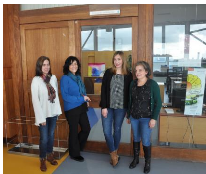
A Sección de Extensión Universitaria organiza os proxectos de voluntariado propios da Universidade