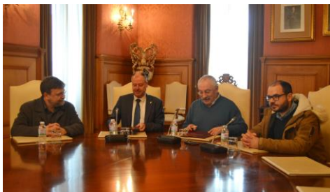
Un intre da sinatura deste convenio no Pazo Provincial

Historias de e sobre mulleres. Unhas inventadas e soñadas, outras reais, froito das vivencias e experiencias das súas autoras, de diferentes idades e nacionalidades. Todas elas forman parte da nova exposición organizada polo persoal da biblioteca da Facultade de Filoloxía e Tradución, que despois de ter unha mostra conmemorativa sobre Rosalía de Castro e a súa obra, prosegue a súa homenaxe a mulleres escritoras e artistas cunha recompilación dedicada ás debuxantes e guionistas de bandas deseñadas máis representativas da actualidade. Cómic, tiras cómicas, novelas gráficas e calquera outro tipo de viñetas ilustradas realizadas por mulleres estarán expostas no vestíbulo desta biblioteca. +info